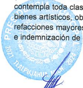
C. JORGE MEDINA MONTOYA PRESIDENTE MUNICIPAL

1.2.4.1. La cuenta de MOBILIARIO Y EQUIPO DE ADMINISTRACIÓN ; cuyo saldo es de $ 2,695,686.00 (Dos Millones Seiscientos Noventa y Cinco Mil Seiscientos Ochenta y Seis Pesos 00/100 M.N.) , contempla toda clase de mobiliario y equipo de administración, bienes informáticos y equipo de cómputo, bienes artísticos, obras de arte, objetos valiosos y otros elementos coleccionables. Así como también las refacciones mayores correspondientes a este concepto. Incluye los pagos por adjudicación, expropiación e indemnización de bienes muebles a favor del Gobierno.