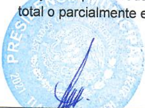
C. JORGE MEDINA MONTOYA PRESIDENTE MUNICIPAL

7.5.1 La cuenta de CONTRATOS PARA INVERSIÓN MEDIANTE PROYECTOS PARA PRESTACIÓN DE SERVICIOS (PPS) Y SIMILARES ; revela un saldo por la cantidad de $ 0.00 ( Cero Pesos 00/100 M.N. ), mismo que concentra el monto comprometido a pagar de los contratos de obra o similares a través de los Proyectos para Producción de Servicios y acciones de fomento, formalmente aprobados y que aún no están total o parcialmente ejecutados.