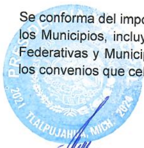
C. JORGE MEDINA MONTOYA PRESIDENTE MUNICIPAL

Se conforma del importe del gasto por las participaciones y aportaciones para las Entidades Federativas y los Municipios, incluye las destinadas a la ejecución de programas federales a través de las Entidades Federativas y Municipios, mediante la reasignación de responsabilidades y recursos, en los términos de los convenios que celebre el Gobierno Federal con éstas.