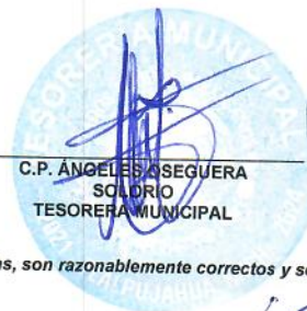
C.P. ÁNGELES ASEGUERA SOLDADO TESORERA MUNICIPAL