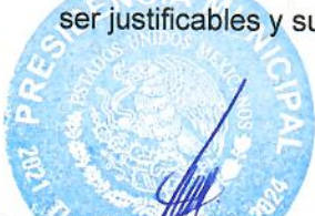
C. JORGE MEDINA MONTOYA PRESIDENTE MUNICIPAL

2.2.6.2 La cuenta de PROVISIÓN PARA PENSIONES A LARGO PLAZO ; con saldo por la cantidad de $ 0.00 (Cero Pesos 00/100 M.N.) , representa las obligaciones a cargo del ente público, originadas por contingencias de pensiones, cuya exactitud del valor depende de un hecho futuro; estas obligaciones deben ser justificables y su medición monetaria debe ser confiable, en un plazo mayor a doce meses.